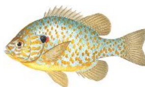
Perca-sol ( Lepomis gibbosus )